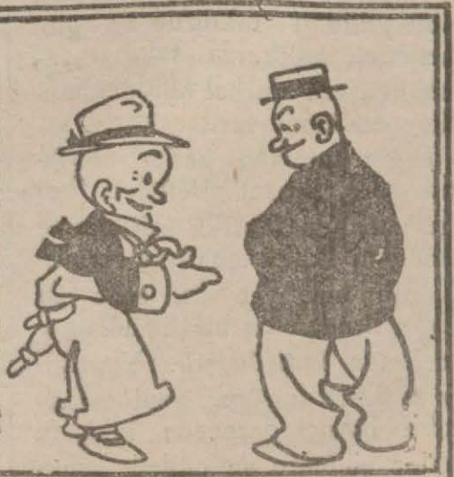
5: Hasan Bey — Elbette ya... Millette gramofon iptilâsı varken kafeteki bülbülün sesini kim dinler!