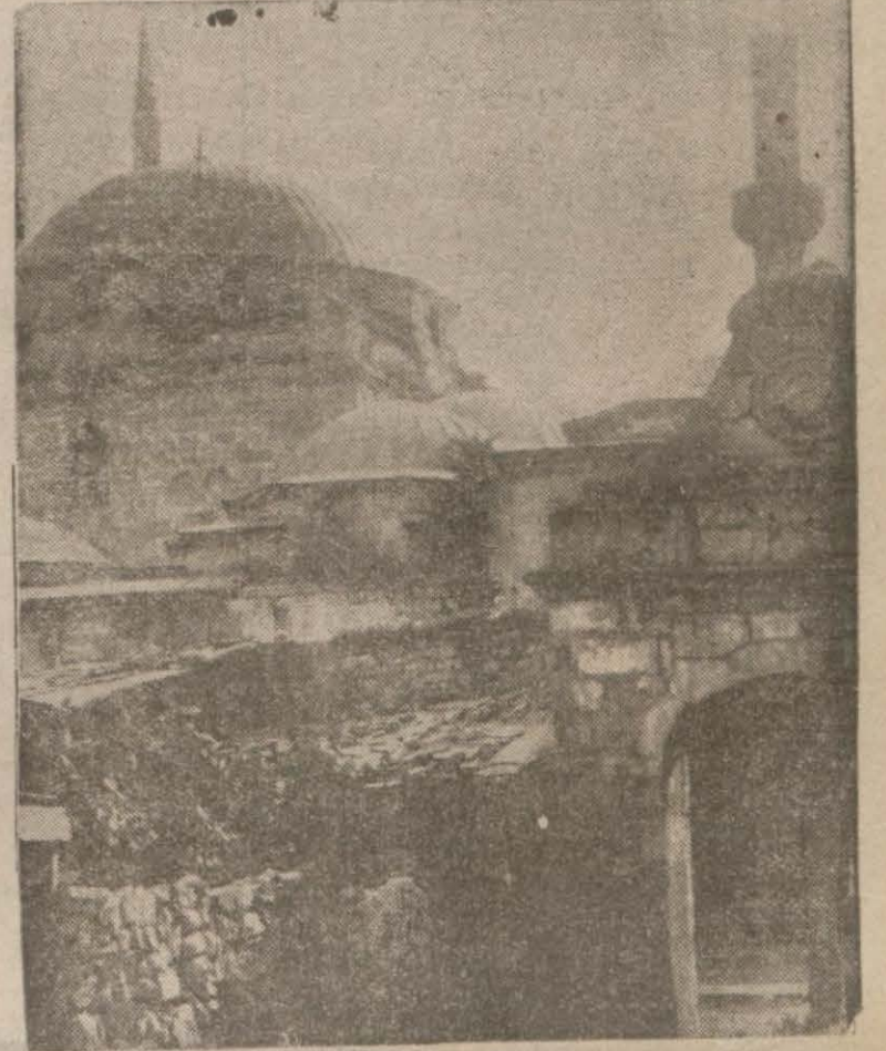
Mahmutpaşa caminin bir kısmı

Haber aldığımız göre, Mahmutpaşa camiine son günlerde kurşun hırsızları musallat olmuşlardır. Bundan yirmi gün kadar evvel camiin kubbesine çıkan hırsızlar beş yüz kiloya yakın kurşun çalıp gitmişlerdir. Fakat bu sirkat üzerine tertibat alınmış olduğundan hırsızların ikinci bir ziyareti muvaffakiyetle neticelenmemiş, sökülün 350 kilo sıklendeki kurşunlar nakledilirken hırsızlar yakalanacaklarını anlamışlar ve kurşunları bırakıp kaçmışlardır. Polisler kurşunları camiin kayyum başısı Hafız Ahmet Efendiye teslim etmişler, kayyumbaşı da Evkafa