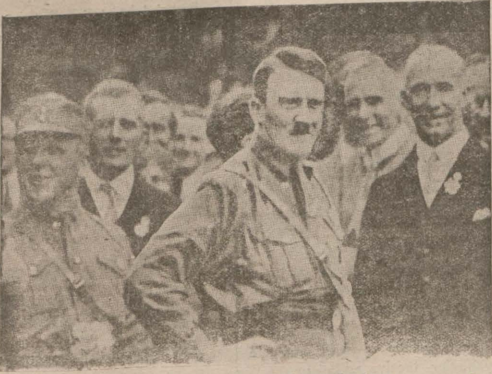
Hitler (ortada) ve parti arkadaşları

Hitler Ordusu İşbaşındadır. Almanyanın İstikbalinden Endişe Ediliyor