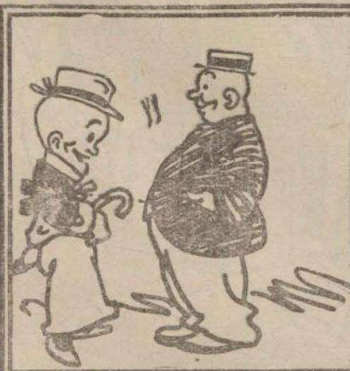
1: Komşu — Hasan Bey, buhran kuş piyasasına da tesir etmiş.