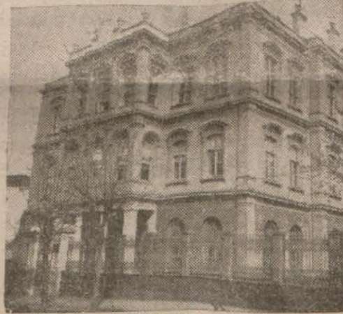
İstanbul Halk Evi

Şehrimiz Halk Evinin içtimal muavenet şubesi faal bir vaziyete geçmek üzeredir. Şimdiki halde verilen kararların pürüzsüz bir şekilde tatbik edilmesi için mesai usullerinin tespitine uğraşmaktadır. Öğrendiğimize göre şimdilik şu esaslar tespit edilmiştir: İstanbulun bazı mahalle ve semtlerinde fakirlere sıcak yemek ve çorba dağıtmak için yardım mutfakları tesis etmek, fakirlerin yıkanmaları için hamamlar açmak, fakir kadın ve kızların çalışıp