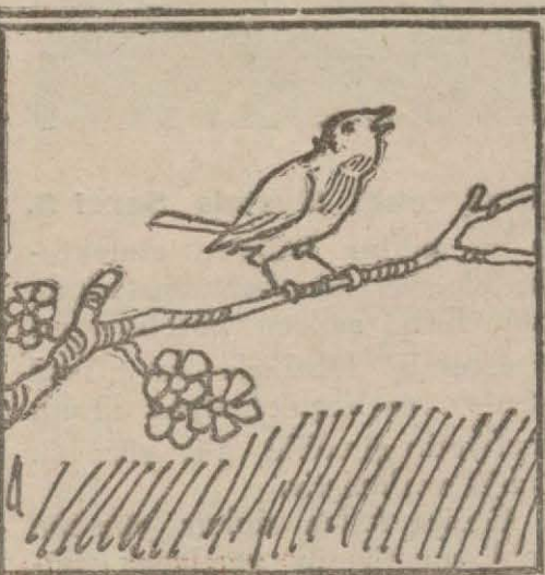
4 — Hele o şakrak bülbüllere kimseler metelik vermiyor muş.