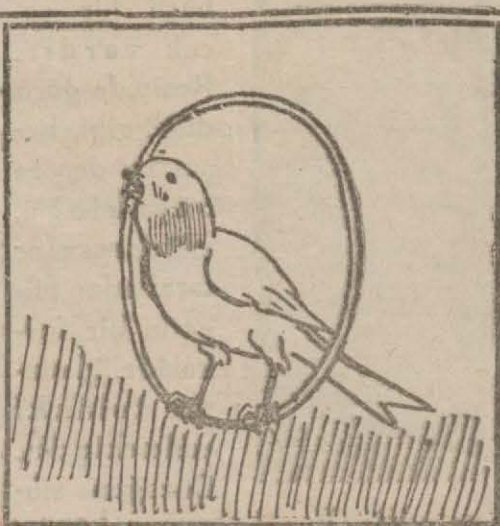
3 — Amerikadan getirilen fıstık gibi kanaryalara...